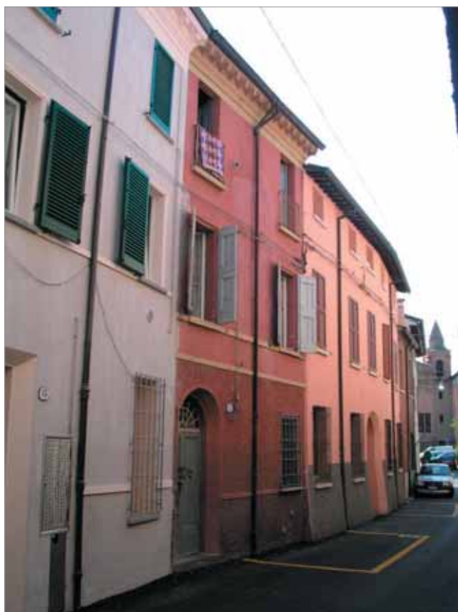
Via Garzoni 15 Fronte Principale